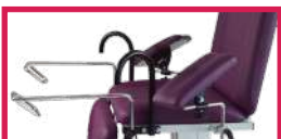
ACC 113U-105 Jeu de poignées de maintien latérales, avec étaux pour adapter une paire d'étriers prêt à fixer sur fauteuil