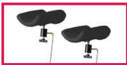
ACC 964 Jeu de repose jambes noir, sur rotule mousse polyuréthane, diam. 14mm, sans étau