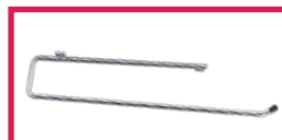
ACC 125 Porte rouleau adaptable tous modèles