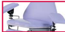
ACC 514-ASSISE Protection plastique assise