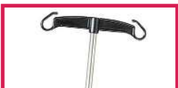
ACC 32012 Tige porte-sérum inox diam. 16mm, 2 crochets plastiques, sans étau