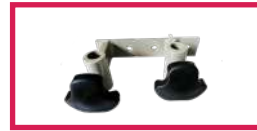
ACC 535 Jeu d'étaux double diam. 14mm et 16mm pour gouttière + tige porte-sérum