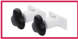
ACC 537 Jeu d'étaux diam. 14mm pour gouttières et étriers pour toutes gammes sauf LUVIA