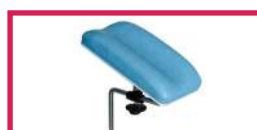
ACC 110 Gouttière prise de sang Avec ferrure, sans étau, l'unité