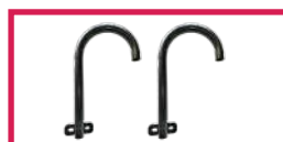
ACC 113U Jeu de poignées de maintien latérales, sans étau prêt à fixer sur fauteuil