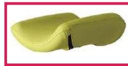
SLFEMIREPOSE Housse prélude pour repose jambes (ACC964), l'unité