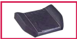
ACC 514-JAMBIÈRE Protection plastique pour jambière