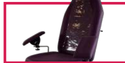
ACC 517-512 Protection plastique pour dossier