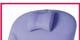
ACC TETERGO Tête ergonomique amovible