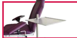
ACC 910-PLAT02 Plateau inox support 340x340 avec étau