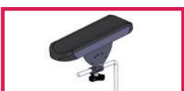
ACC 110POLY Gouttière prise de sang polyuréthane avec ferrure Sans étau, l'unité