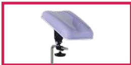
ACC 514-GOUT Protection gouttière en plastique transparent, l'unité