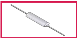
ACC 54005 Tête 1/2 lune largeur 55cm revêtement non feu M1